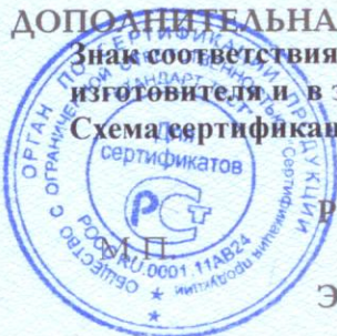
Схема сертификации – 3.

Знак соответствия по ГОСТ Р 50460 наносится на продукцию рядом с товарным знаком изготовителя и в эксплуатационную документацию.